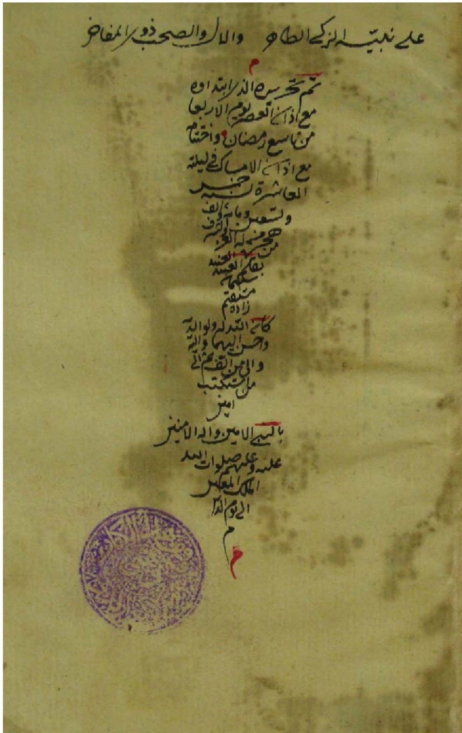
نهاية نسخة مكتبة السليمانية